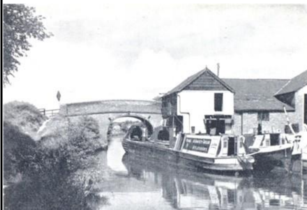
Canal de Gannel, New Mill, Tring (Noroeste de Londres). Fotografia de 1952